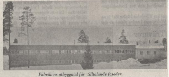
Fabrikens utbyggnad får tilltalande fasader.